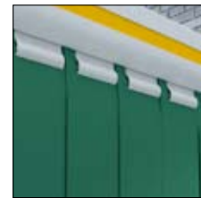
Lamas de protección de soldadura