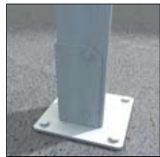
Soportes de aluminio