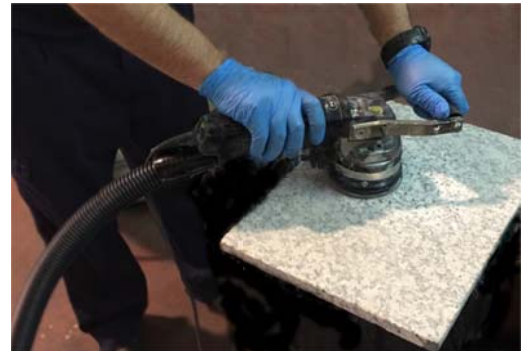
Abujardado con aspiración

Dando una efectividad de aspiración del polvo de casi el 100%